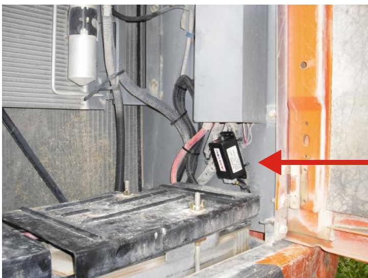
Installation des elektronischen Modulators im Batteriekasten