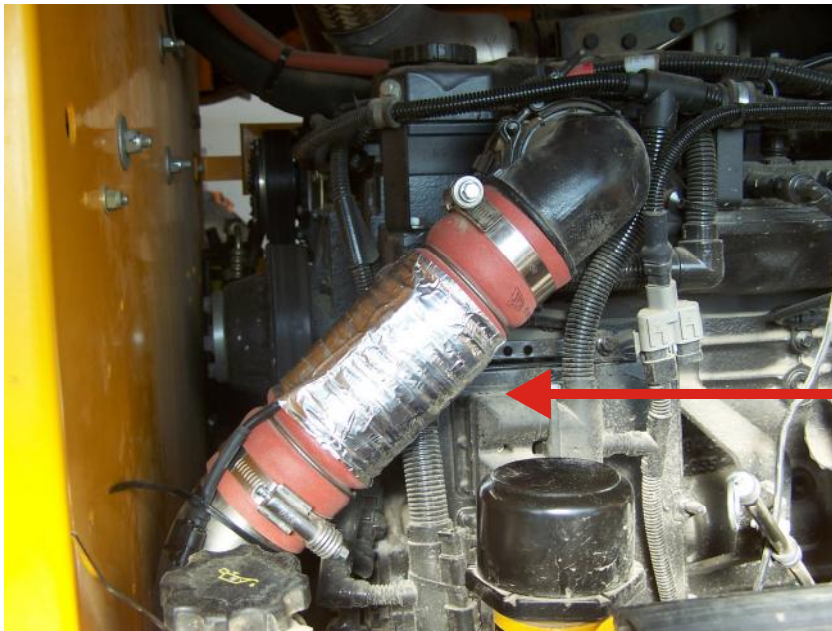
Aufbau einer Erregerspule auf dem Ladeluftschlauch nach dem Ladeluftkühler